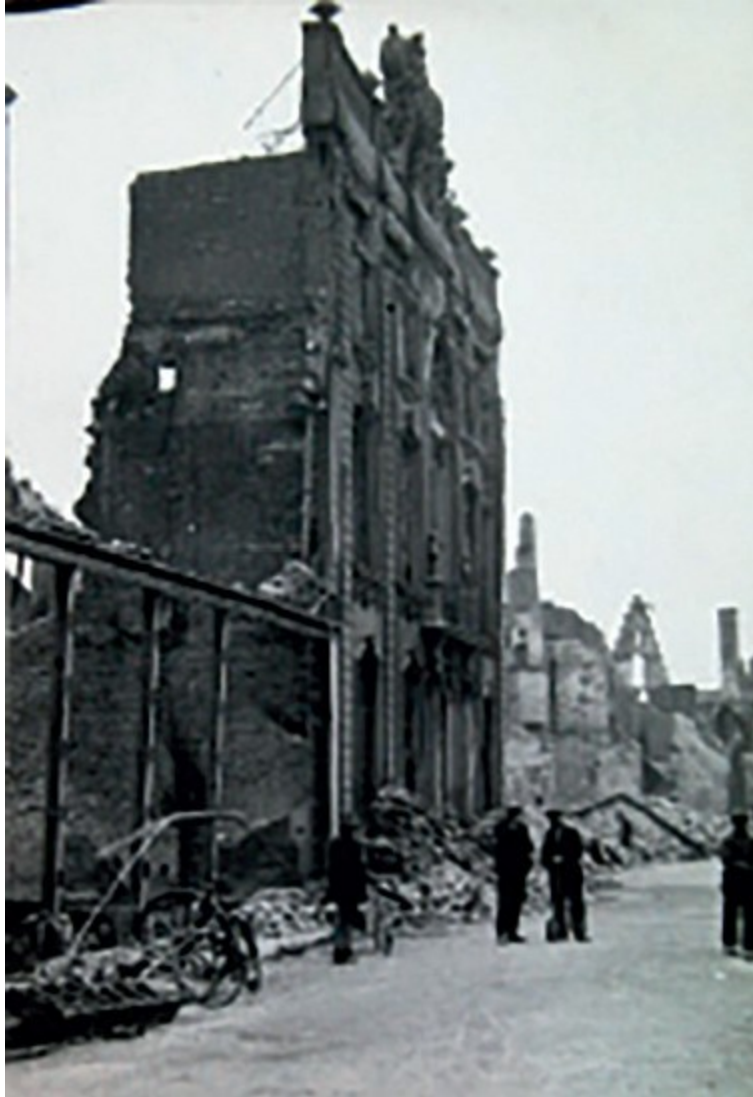
Het door brand in de oorlog verwoeste gebouw van de Provinciale Bibliotheek aan de Lange Delft in Middelburg, mei 1940.

Tijdens de Tweede Wereldoorlog werden er door de oorlogshandelingen verschillende bibliotheken verwoest en collecties vernietigd (waaronder Middelburg, 1940). Daarnaast wilden de Duitsers de collecties ‘zuiveren’ van ‘nietarisch’ bezit. Om te kunnen blijven draaien werkten veel bibliotheken mee aan deze politiek. Een houding die de CV na de oorlog overigens sterk kwalijk werd genomen.