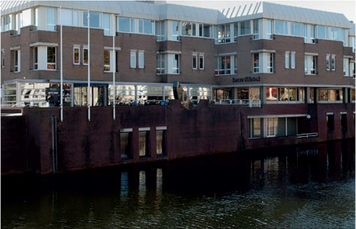
De Zeeuwse Bibliotheek te Middelburg. Foto: W. Helm, oktober 2010. Bron: ZB/Beeldbank Zeeland, rec.nr. 126388.

Met de bibliotheekvernieuwing die sinds beginjaren van de 21ste eeuw is ingezet wijzigden ook in Zeeland de taken van de ZB als PBC naar de Provinciale Ondersteuningsinstelling (POI). Als POI is ZB verantwoordelijk voor de regie- en adviesrol binnen het Zeeuwse Bibliotheeknetwerk. De ZB vervult als POI een faciliterende rol op het gebied van ICT en functioneel beheer van de infrastructuur (inclusief aansluiting op de landelijke infrastructuur), collectievorming en dienstverlening aan het onderwijs. Speerpunt in de komende jaren is innovatie.