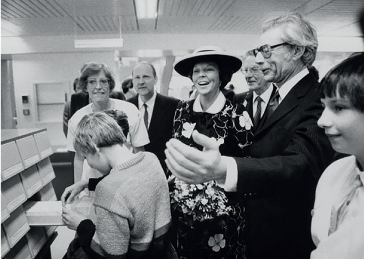
Officiële opening Zeeuwse Bibliotheek door koningin Beatrix. Links van haar mevrouw S.J. van Dixhoorn en rechts burgemeester drs. P.A. Wolters en de bibliothecaris mr. W.D. de Bruine. Foto: J. Wolterbeek, 24 april 1985. Bron: ZB/Beeldbank Zeeland, rec.nr. 81302.

Een van de bindende factoren in de samenwerking was het toenmalige bibliotheekstelsel Oriël waarin de catalogus van het uitleensysteem aan gekoppeld werd. Alle titels van de bibliotheken waren op microfiche raadpleegbaar in de verschillende vestigingen. Begin jaren '80 werden de microfilms van de Provinciale Bibliotheek en de microfichecatalogus samengevoegd. Begin 2004 zijn ook alle tarieven van de Zeeuwse vestigingen gelijkgetrokken. Transport van materialen werd geregeld door de PBC met een bestelbus.