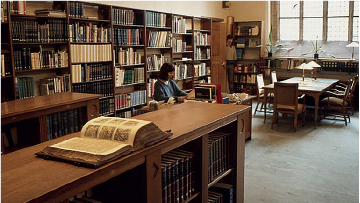
Een impressie van de studiezaal van de Provinciale Bibliotheek in de Middelburgse Abdijgebouwen. Foto: W. Helm, 1982. Bron: ZB/Beeldbank Zeeland, rec.nr. 140842.

Nadat er enkele jaren een tijdelijk onderkomen werd gevonden aan de Dam verhuisde de Provinciale Bibliotheek in 1953 (weer) naar de Middelburgse Abdijgebouwen. Daarna ontwikkelde de Provinciale Bibliotheek zich tot een instituut met een brede gebruikerskring. Dit hangt onder andere samen met de groei van de bevolking, de verbreding van het onderwijs en een beleid gericht op een maximale toegankelijkheid. Verder kwam er geleidelijk een intensieve vorm van samenwerking met de andere in Zeeland werkzame bibliotheken tot stand, met name op het gebied van het interbibliothecair leenverkeer.